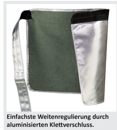
Einfachste Weitenregulierung durch aluminisierten Klettverschluss.